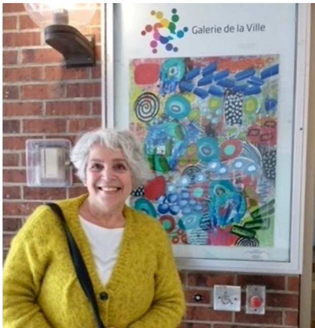
« Effulgence » par Frankie Cambria