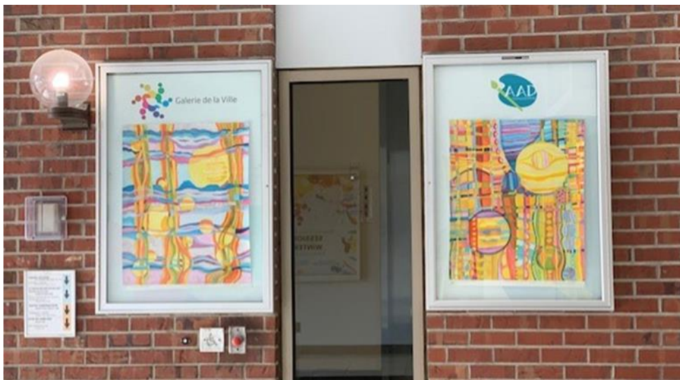
Œuvres affichées en février ci-haut. Celles de mars ci-bas.